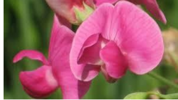
2. Gelin burçağı ( Lathyrus trachycarpus )