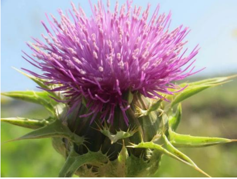
1. Maral dikenini ( Centaurea stapfiana )