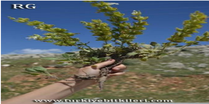
3. Yitik geven ( Astragalus diyarbakirensis )